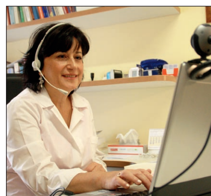
Applicazione in ambito medico