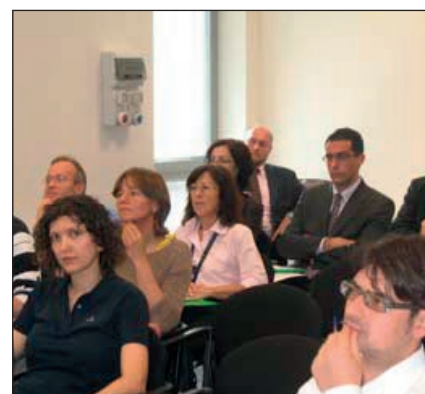
Formazione in aula