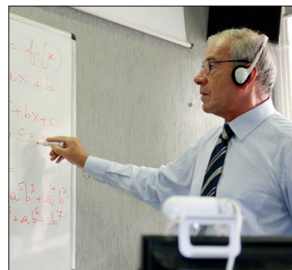
Formazione a distanza

✚ Formazione viale Monte Santo, 1/3 - Milano Tel. +39 0342 514 140 formazione@virtualvalley.it